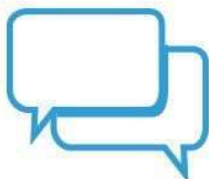
DONNER ET PRENDRE DES NOUVELLES DE SES PROCHES