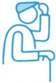
PERSONNES ÂGÉES DE PLUS DE 65 ANS