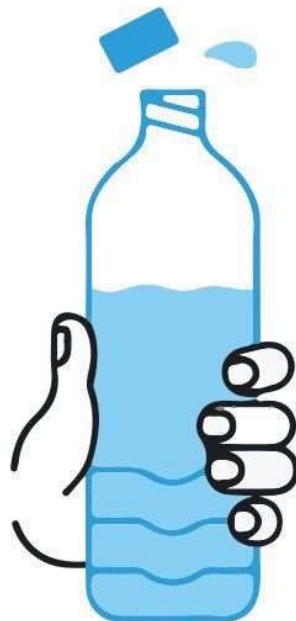
BOIRE RÉGULIÈREMENT DE L'EAU