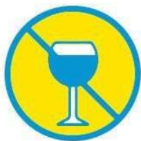
NE PAS BOIRE D'ALCOOL