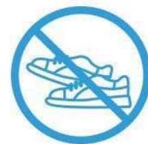
ÉVITER LES EFFORTS PHYSIQUES