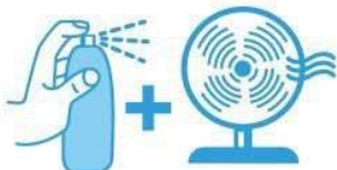
MOILLER SON CORPS ET SE VENTILER