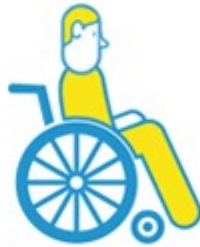
PERSONNES HANDICAPÉES OU MALADES À DOMICILE